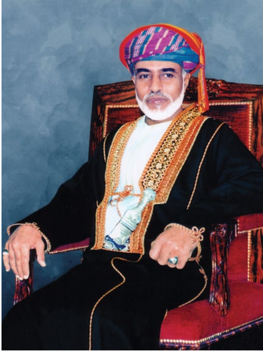
حضرة صاحب الجلالة السلطان قابوس بن سعيد المعظم