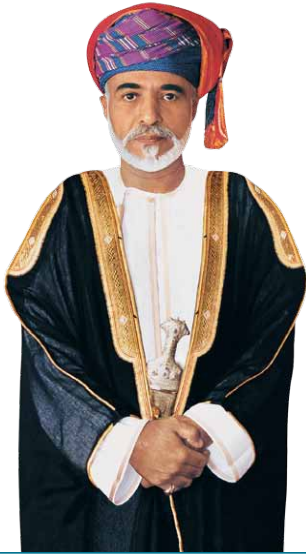
حضرة صاحب الجلالة السلطان قابوس بن سعيد المعظم